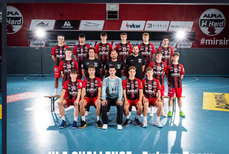
HLA CHALLENGE - Future Team