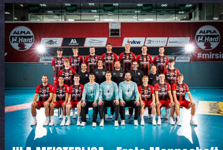
HLA MEISTERLIGA - Erste Mannschaft

Änderungen vorbehalten. Alle Spielzeiten über Link auf www.hchard.at abrufbar.